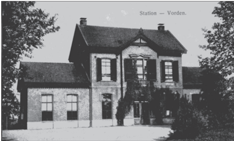
Het stationsgebouw van de Nederlandse Spoorwegen in Vorden, rond 1935.

De NS was zeer kieskeurig in de keuze van de toekomstige bewoners en/of gebruikers van de door haar afgedankte stationsgebouwen. De stichting SOS kreeg vele aanvragen van eventuele gegadigden, vooral van particulieren, die het gebouw als woonhuis wensten te betrekken, maar het merendeel hiervan viel al af, vooral door de strenge eisen van de NS. De stichting was dan ook zeer verbaasd dat het station Almen-Laren betrokken mocht worden door een Amerikaanse kunstenaar, Freedman geheten. Of het met de kunst niet zo hard liep, is niet bekend geworden, maar later is zij daar gestart met een cateringbedrijf.